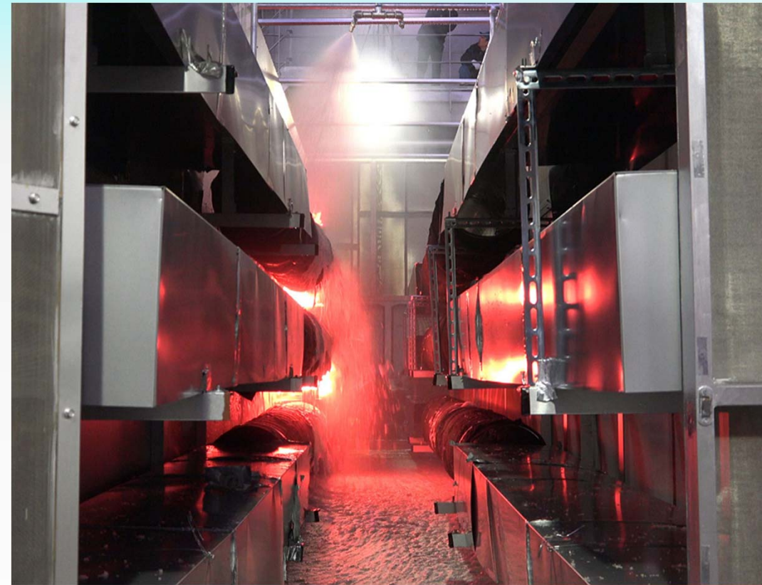
固定ヘッド+光ファイバー温度監視